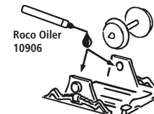
Roco Oiler 10906

Les pièces de finition illustrées sont à monter par le modéliste. Le jeu de pièces peut comprendre d'autres pièces (non illustrées) qui sont destinées à autres versions du modèle et qui sont superflus à la variante présente.